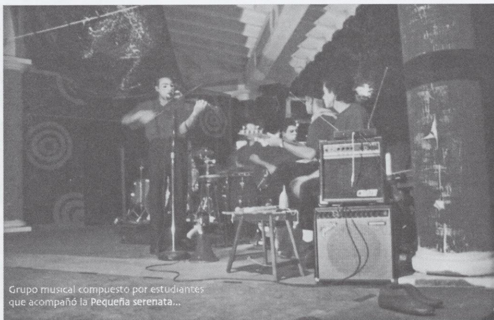
Grupo musical compuesto por estudiantes que acompañó la Pequeña serenata...

sesenta y setenta. Montajes cuyos textos fueron desarrollados, en muchos casos, por los actores-integrantes de las agrupaciones. Piezas teatrales, trabajadas en función del público y sus circunstancias; hecho que