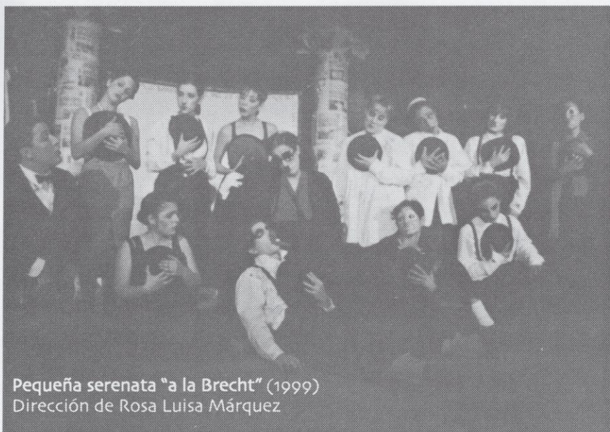
Pequeña serenata "a la Brecht" (1999) Dirección de Rosa Luisa Márquez

Dentro del contexto didáctico, uno de los mayores aciertos es la creación —a manera de taller— de un nuevo texto dramático. Los alumnos del curso Taller de teatro experimental , que dicta la doctora Márquez en el Departamento de Drama, se