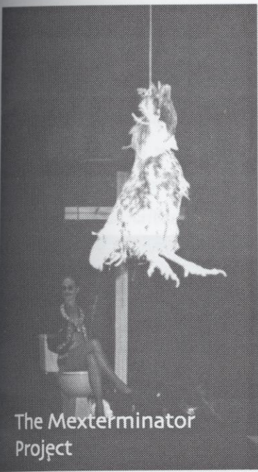
The Mexterminator Project