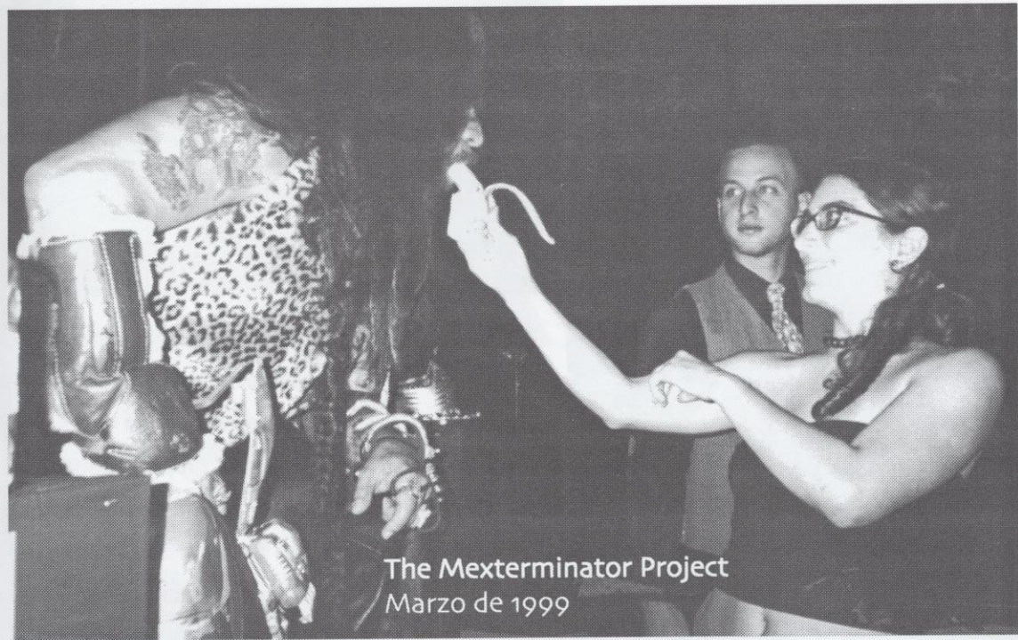
The Mexterminator Project Marzo de 1999

ni tiene por qué serlo, ni hay por qué verlo