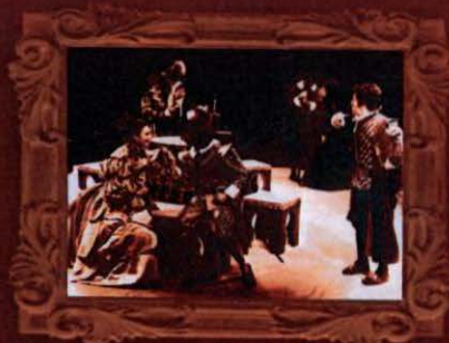
1974 TEATRO UPR