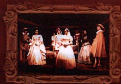
2003 CORRALÓN DE SAN JOSÉ