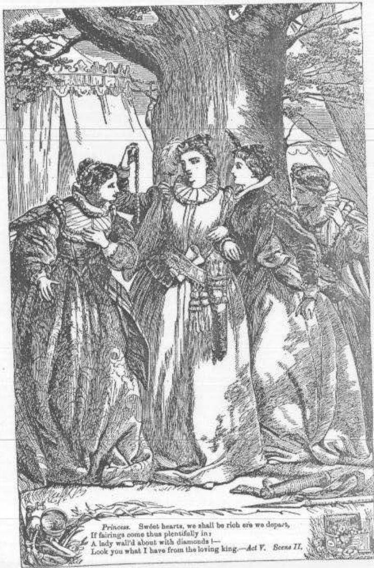
Princess. Sweet hearts, we shall be rich ere we depart, If fairings come thus plentifully in; A lady wall'd about with diamonds!— Look you what I have from the loving king.— Act V. Scene II.

Ros. Madam, came nothing else along with that?