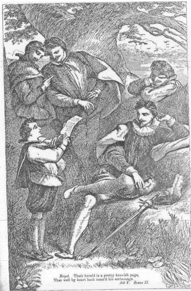
Boyet. Their herald is a pretty knavish page, That well by heart hath conn'd his embassy. Act V. Scene II.

Prin. And will they so? The gallants shall be task'd, For, ladies, we will every one be mask'd;