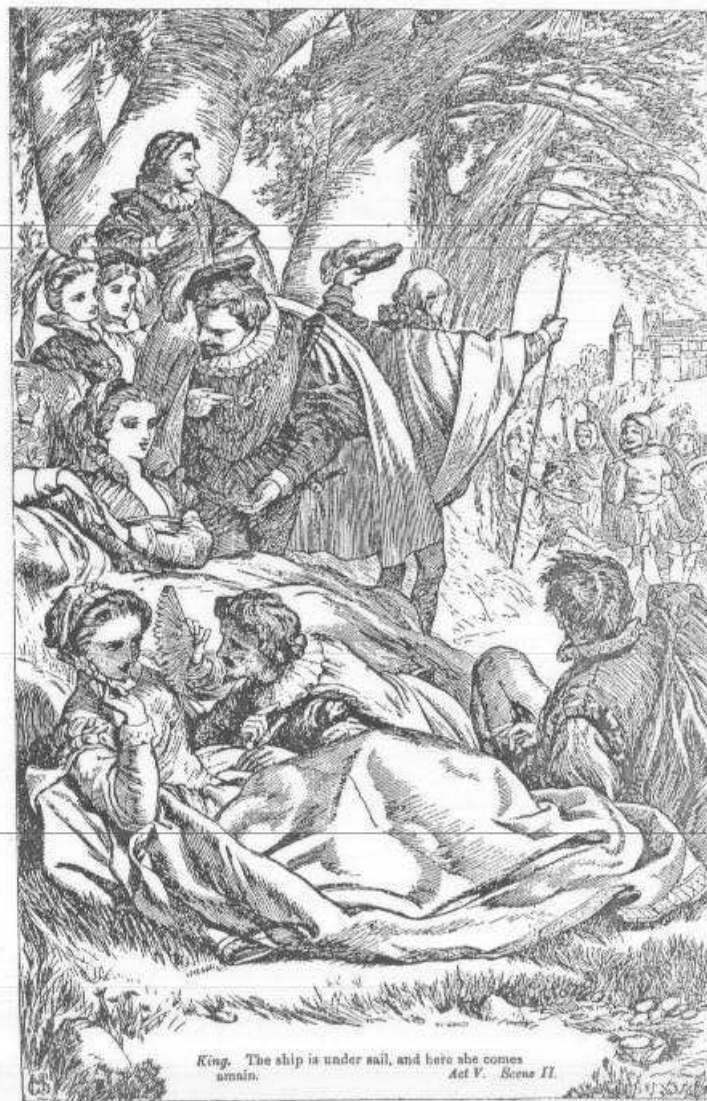
King. The ship is under sail, and here she comes amain. Act V. Scene II.

Ber. My hat to a halfpenny, Pompey proves the best Worthy.