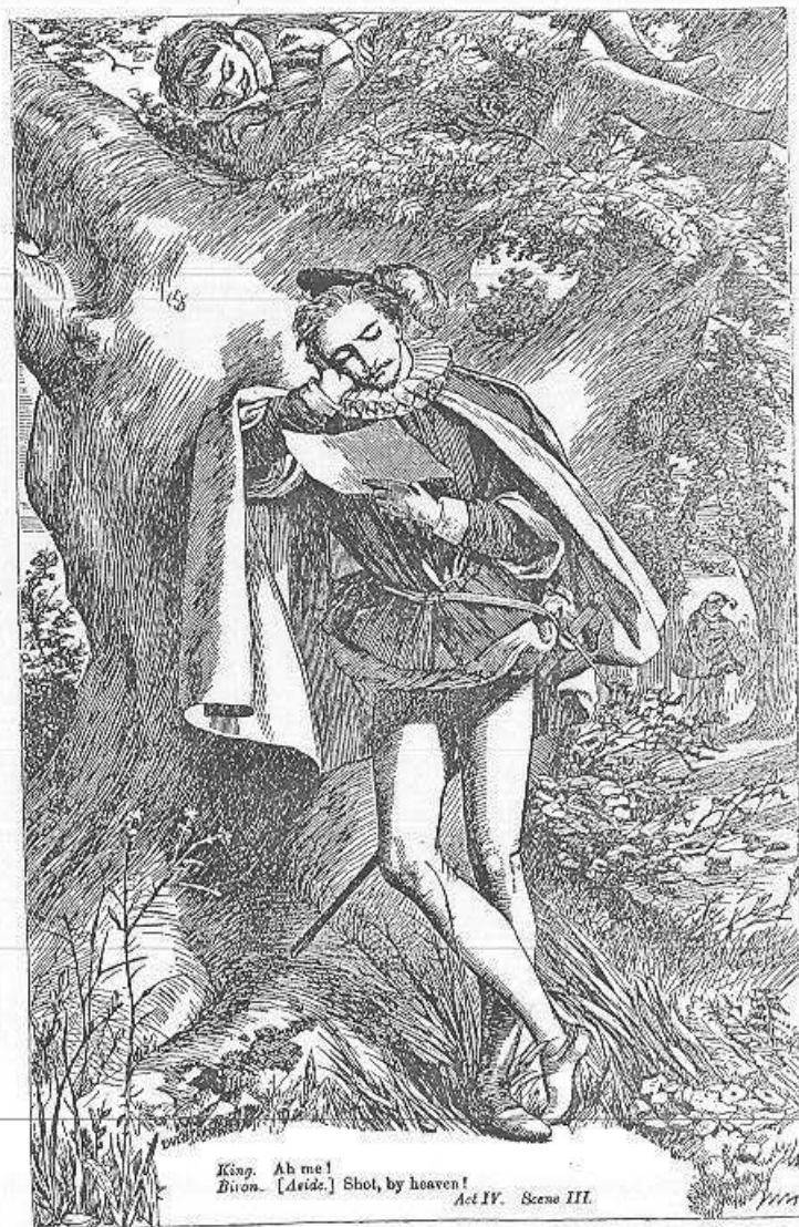
King. Ah me! Buon. [ Arise. ] Shot, by heaven! Act IV. Scene III.

"So sweet a kiss the golden sun gives not 95 To those fresh morning drops upon the rose, As thy eye-beams 96 , when their fresh rays have smote 97 The night of dew 98 that on my cheeks down flows; Nor shines the silver moon one half so bright Through the transparent bosom of the deep, As doth thy face through tears of mine give light. Thou shin'st in every tear that I do weep; No drop but as a coach doth carry thee; So ridest thou triumphing in my woe. Do but behold the tears that swell in me, And they thy glory through my grief will show.