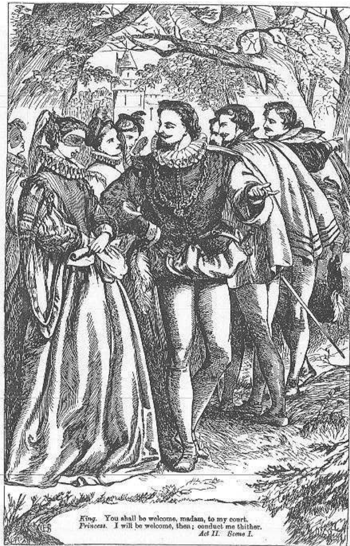
King. You shall be welcome, madam, to my court. Princess. I will be welcome, then; conduct me thither. Act II. Scene I.

Ber. Dit not I dance with you in Brabant once?