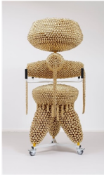
Haegue Yang, Handles , 2019.