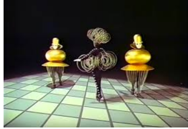
Oskar Schlemmer, Triadic Ballet , 1922-24.