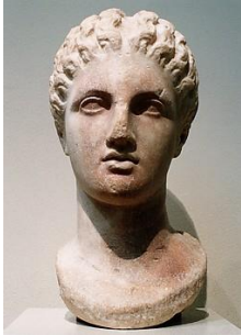
Diosa, siglo IV a.C.