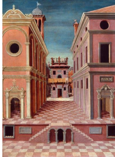
Girolamo da Cotignola