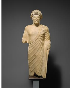
Joven, siglo V a.C.