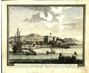
Grabado del siglo XVII atribuido a Peter Schenk.