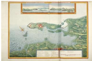
Johannes Vingboons 1665