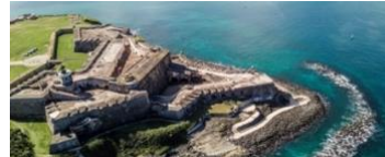
San Felipe del Morro