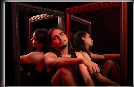
Fotógrafo y artista gráfico Leonardo L. López Pantiga