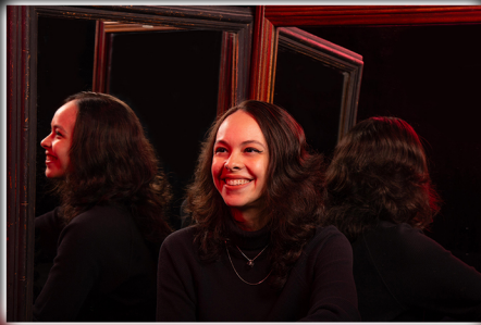
Diseño de sonido Ámbar Sophia Ruíz Duprey